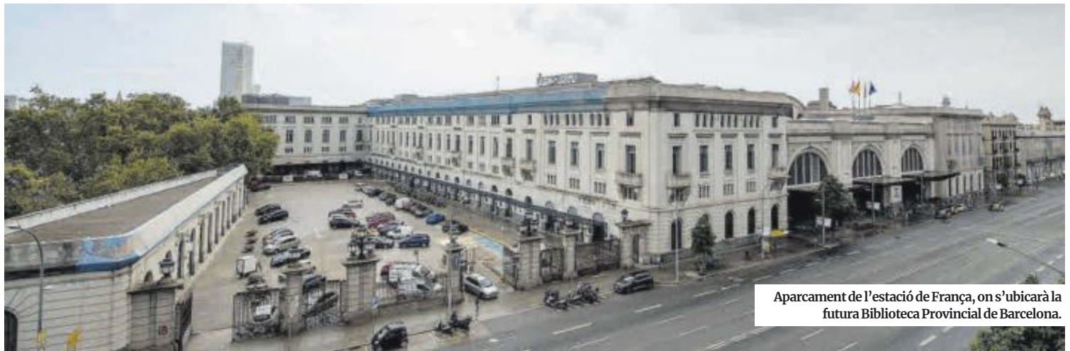
Aparcament de l'estació de França, on s'ubicarà la futura Biblioteca Provincial de Barcelona.

Govern, Generalitat i ajuntament exposen les seves idees sobre el macroequipament 'maleït' de la ciutat, per fi en marxa i amb data d'entrega prevista per al 2027. La potència editorial de la capital catalana es perfila com a eix temàtic.