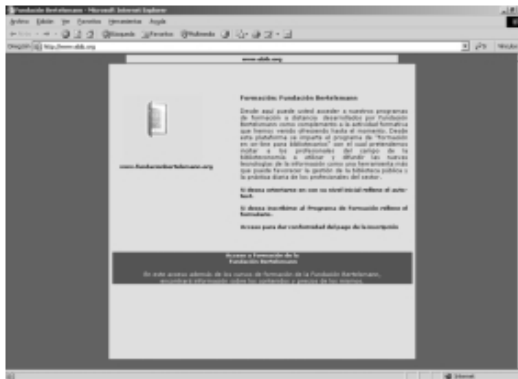
Entrada a la plataforma on-line de la fundación: www.ebib.org

«learning networks» (o redes de aprendizaje colaborativas en línea) permiten generar conocimiento a partir de la interacción mútua desde cualquier lugar donde haya una conexión a internet, hecho que se puede aprovechar perfectamente para generar espacios dedicados a debatir temas relacionados con la gestión profesional y la práctica bibliotecaria.